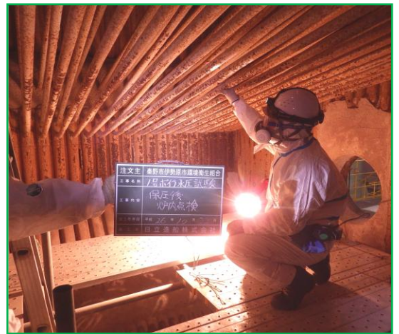
焼却炉内の点検作業