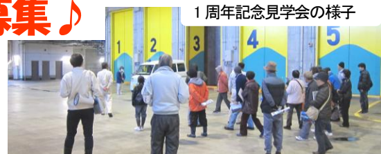
1周年記念見学会の様子

はだのクリーンセンターの竣工から、平成27年1月31日をもって2周年を迎えます。昨年『1周年記念』と題して日曜日に実施した見学会には、151名もの秦野・伊勢原市民の方にご来場いただき、大変盛況となりました。そこで今回も、通常は平日にのみ行っている見学会を土曜日に開催します！平日にはお越しになれない方、ごみ処理設備に関心のある方、普段入る事のできないプラットホームへ入ってみたい方など、お誘いあわせの上ご参加ください。